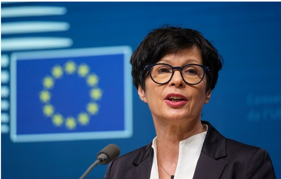
Єврокомісар з питань розширення Марта Кос

Виняток не допоміг би Україні, але могло б у майбутньому підірвати довіру до всього процесу і членства країни у блоку.