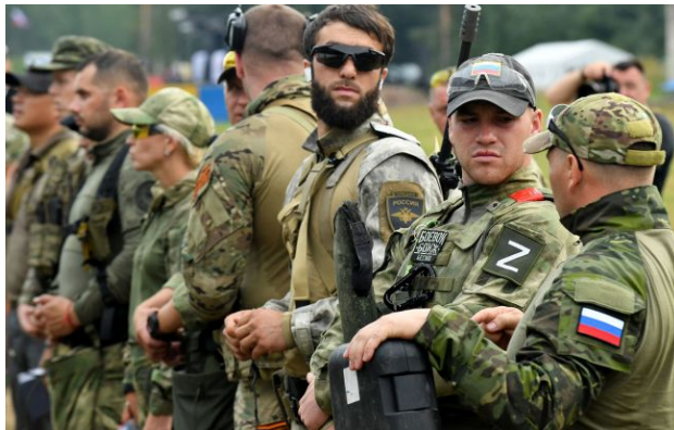
Фото: перекидання військ РФ і боеприпасів щодня під загрозою

Російські окупанти не можуть наступати в дельті Дніпра на Херсонщині. Причиною тому стала критична нестача катерів.