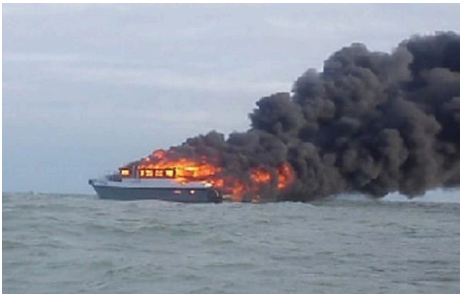
Військові США атакували в Тихому океані ще одне судно наркоторговців

Унаслідок операції ліквідовано чотирьох осіб, імовірно причетних до терористичної діяльності.