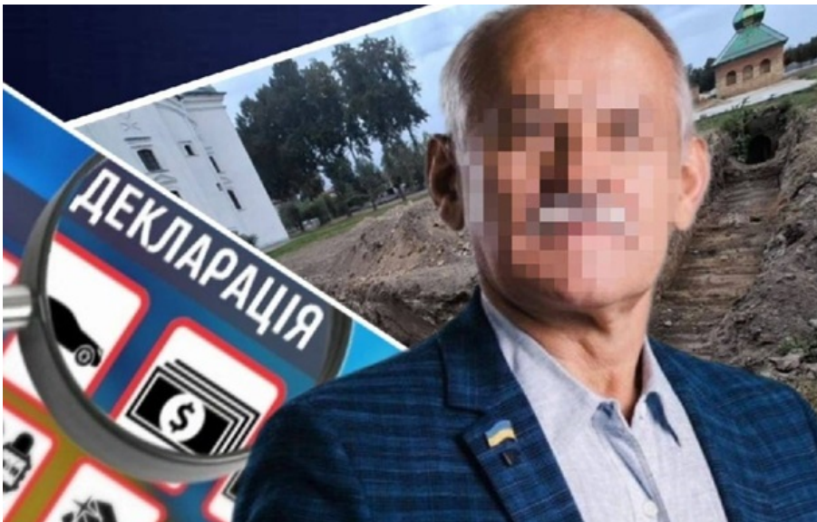
Судитимуть мера одного з міст Київщини

Посадовець тривалий час подавав недостовірні декларації та організував земляні роботи на об'єкті національного значення, завдавши державі збитків на майже 19 млн.