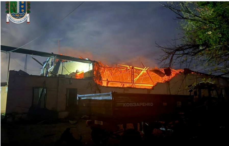
Наслідки атаки

В Ізмаїльському районі через російську атаку сталася пожежа. Наразі встановлюються обсяги пошкоджень та уточнюються наслідки обстрілу.