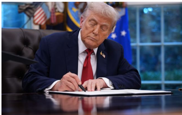
Фото: Дональд Трамп (Getty Images)

Президент США Дональд Трамп заявив, що скасував деякі мита на віскі після візиту короля Британії Чарльза III, що є великою торговою поступкою для Лондона.