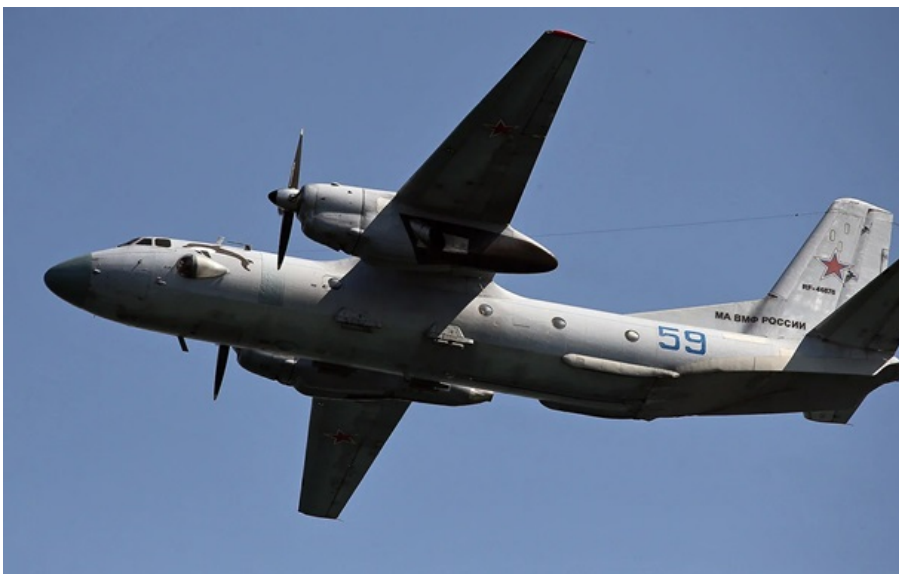
Військово-транспортний літак Ан-26 морської авіації ВМФ РФ