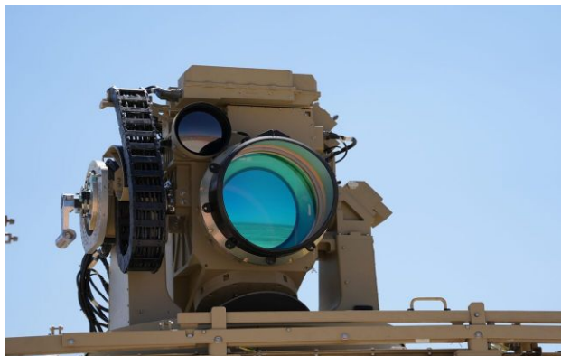
Фото: система ППО з лазерною установкою

Ізраїль передав Об'єднаним Арабським Еміратам сучасні системи протиповітряної оборони, включно з лазерною установкою Iron Veat, для посилення захисту від іранських ракет і дронів.