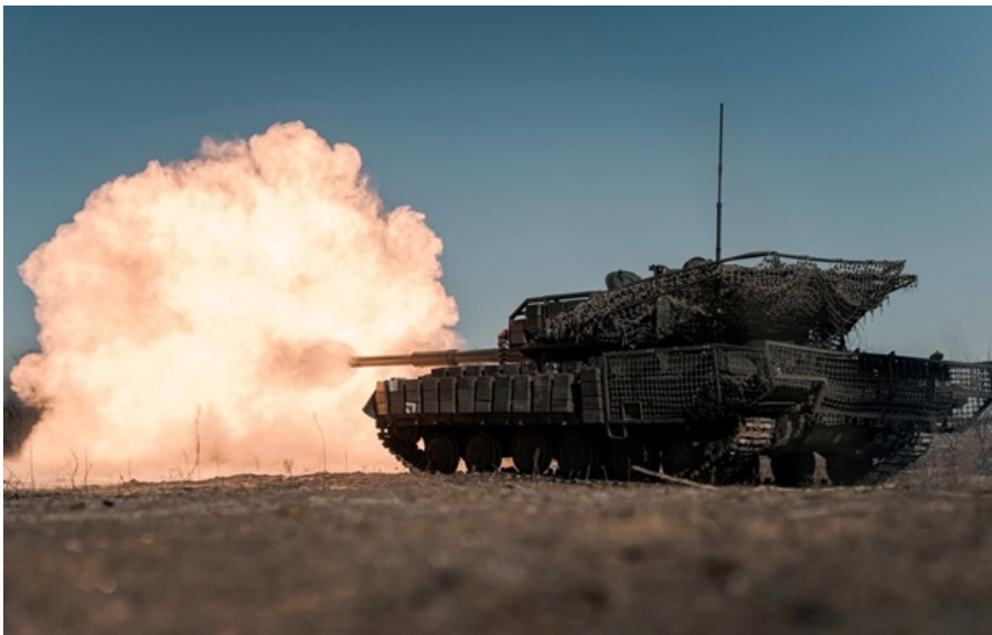
На Лиманському напрямку противник атакував двічі, намагався вклинитися в нашу оборону в бік Діброви та Новосергіївки

Українські захисники протягом вчорашньої доби зупинили п'ять спроб окупантів На Слов'янському напрямку.