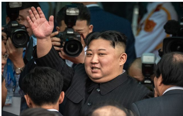
Фото: глава КНДР Кім Чен Ин

На відкритті величній бронзовій скульптурі північнокорейських та російських солдатів, які загинули на війні в Україні, глава КНДР похвалив тих військових, які не здались в полон та самоліквідувались.