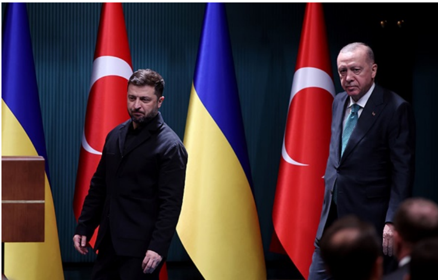
Речник оголосив, що 3 квітня Зеленський поїхав до Стамбула