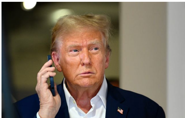
Фото: президент США Дональд Трамп

Президент США Дональд Трамп не знає, чи допоможе державний візит короля Чарльза III поліпшити його відносини з британським прем'єр-міністром Кіром Стармером.