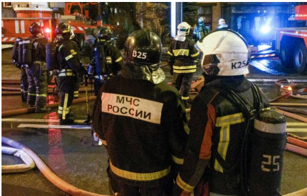
Фото: загроза атаки для регіону вже кілька годин

У ніч на 1 травня місто Туапсе в Росії знову зазнало атаки невідомих безпілотників. Причому це вже четверта за короткий період атака з наслідками.