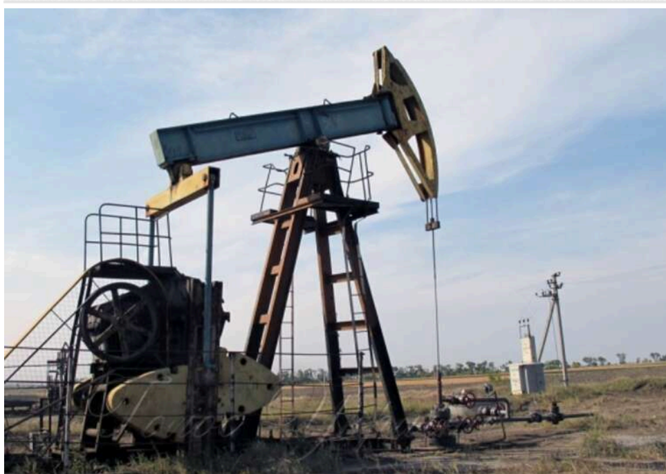
Bloomberg: Експорт нафти РФ знизився до мінімуму через удари по портовій інфраструктурі

Через удари по портам РФ скоротила експорт нафти до мінімуму, – Bloomberg.