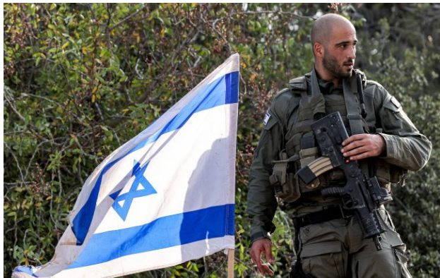
Фото: військовий Ізраїлю (Getty Images)

США відправили 6500 тонн боєприпасів та обладнання до Ізраїлю за 24 години в рамках масштабної логістичної операції.