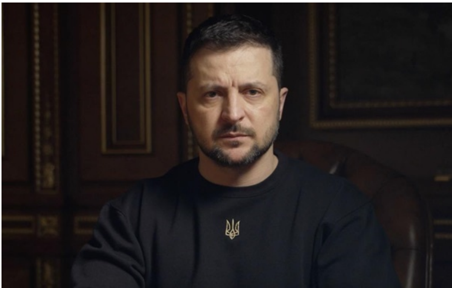
Президент України Володимир Зеленський

Президент додав, що Україна має підтримувати свою систему протиповітряної оборони в робочому стані.