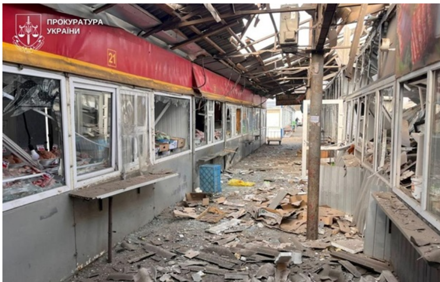
Російські війська атакували ринок у Нікополі

Троє з поранених, - 14-річна дівчинка та двоє чоловіків віком 28 та 72 років, перебувають у тяжкому стані.