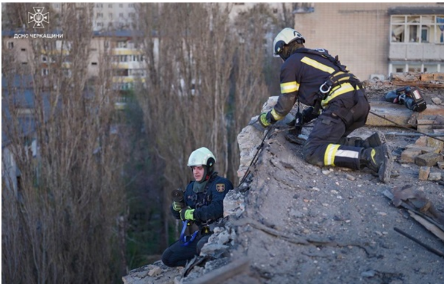
Рятувальники демонтували аварійні будівельні конструкції

Щонайменше чотири багатоповерхівки пошкоджені внаслідок падіння уламків ворожих цілей. Загинув хлопчик.