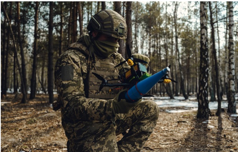
Росія знову порушувала великоднє перемир'я

Російські війська традиційно не дотримались "режиму тиші" і зміцнили свої позиції на фронті.