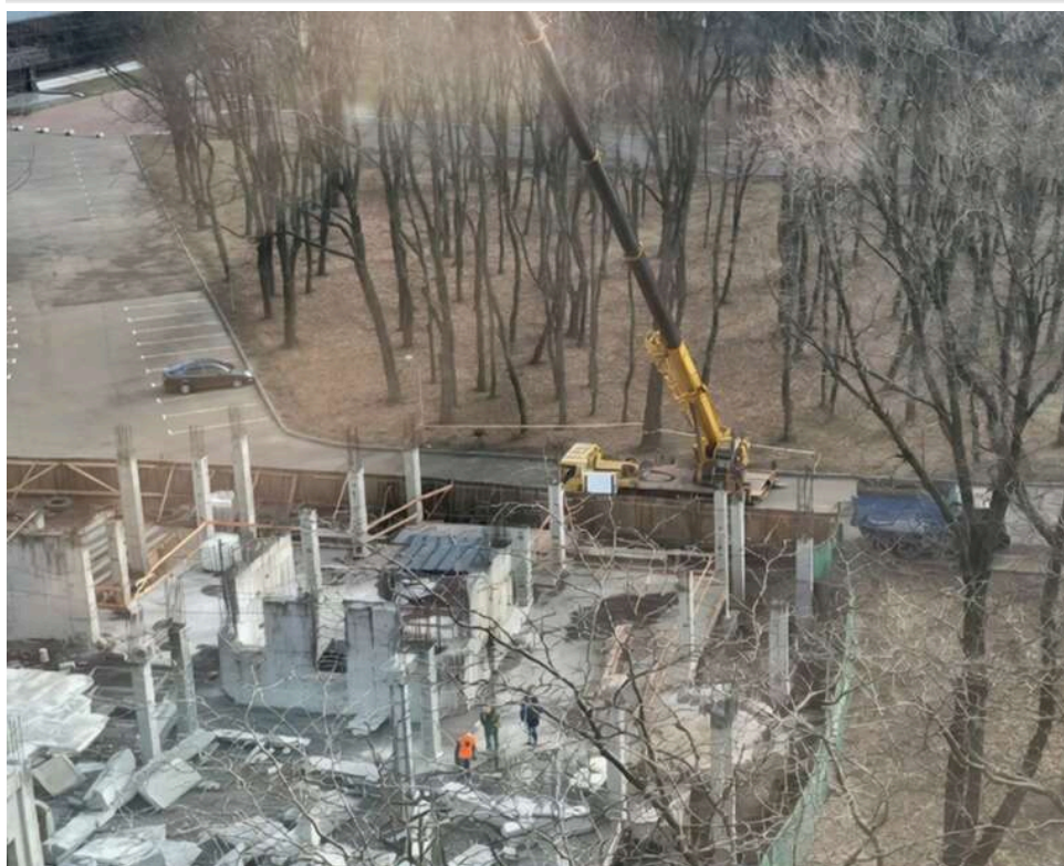
Магія «реконструкції»: як одноповерхове кафе в парку Пушкіна раптово «виросло» до чотирьох поверхів