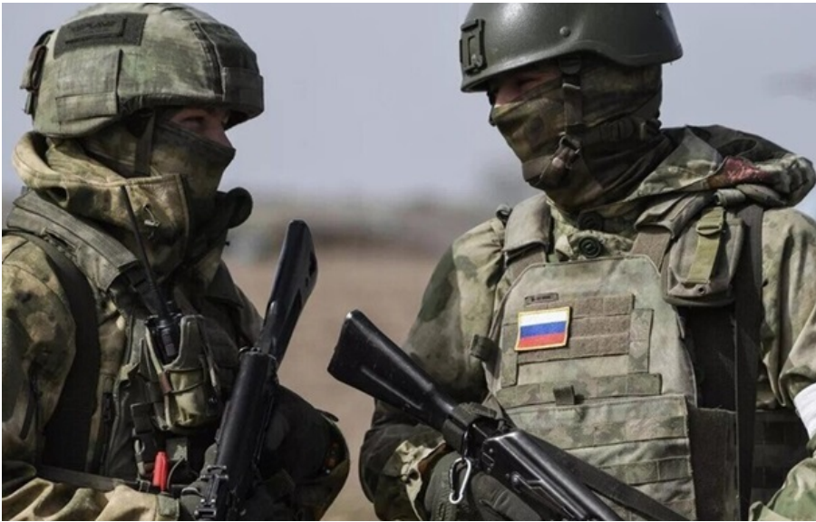
РФ продовжує створювати буферну зону вздовж кордону на Сумщині

Наразі новоутворена площа контролю та інфільтрації противника (червона та сіра зони) вздовж кордону на Сумщині складає близько 150 кв. км.