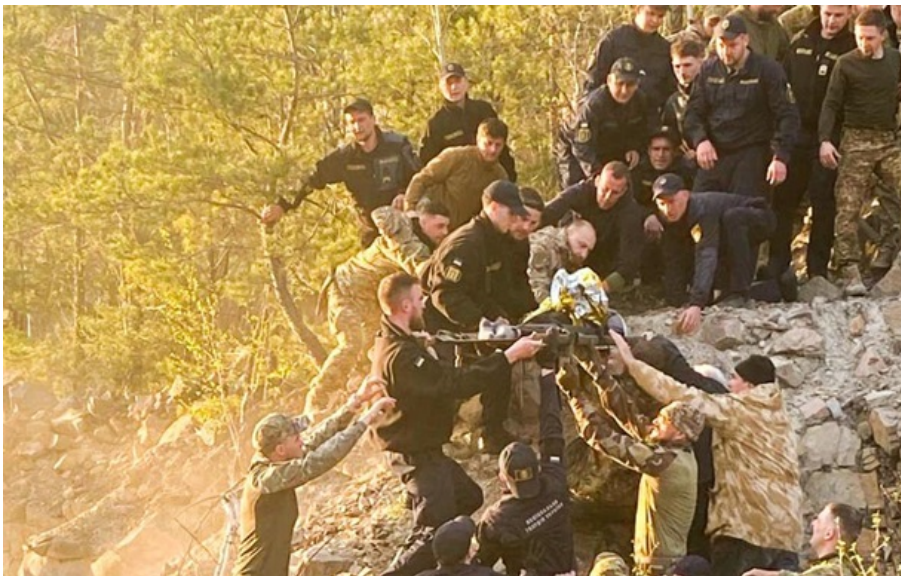
У хлопчика переломи тазу, руки, плеча й ключиці, забої та гематоми

У Сарненському районі Рівненської області добу шукали хлопчика, який пішов кататися на велосипеді й зник.