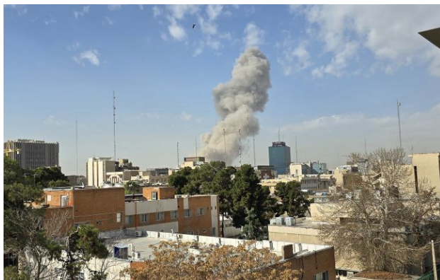
Фото: Тегеран під ударом 28 лютого 2026 року (Getty Images)

Справжня ціна війни США в Ірані ближча до 50 мільярдів доларів, що приблизно вдвічі перевищує публічну оцінку, яку Пентагон навів у свідченнях Конгресу цього тижня.