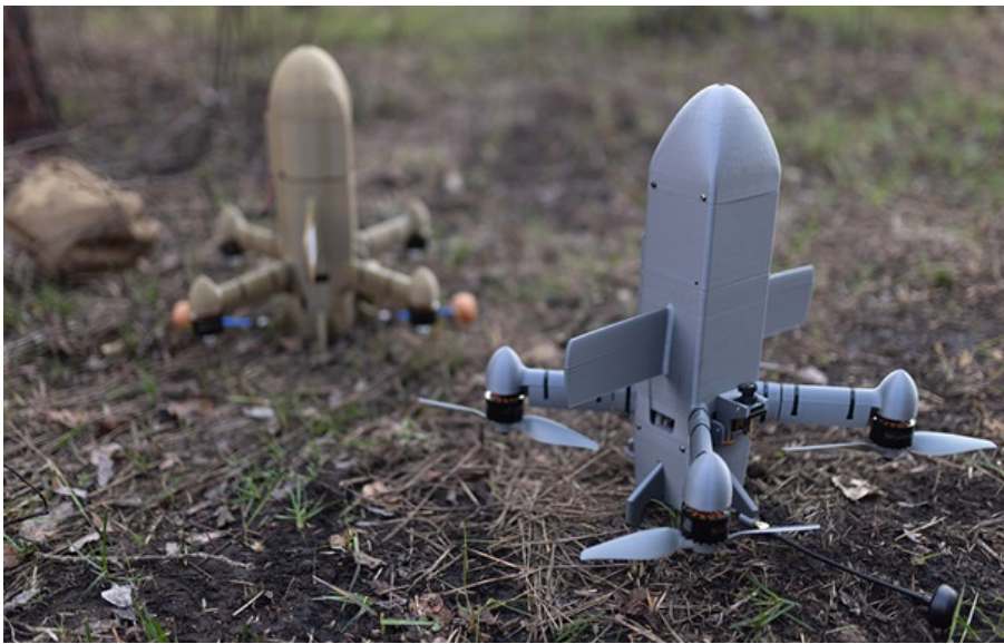
Дрон-перехоплювач Sting

Військовий знищив два дрони "Шахед" на відстані 500 кілометрів за допомогою системи Hornet Vision Ctrl та перехоплювача Sting.