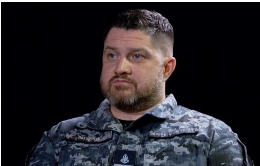
Фото: Суспільне Речник ВМС ЗСУ Дмитро Плетенчук