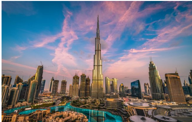
Фото: люди повинні якомога швидше повернутися в ОАЕ (Getty Images)

У четвер, 30 квітня, Об'єднані Арабські Емірати оголосили про введення заборони для своїх громадян на поїздки в Іран, Ліван та Ірак.