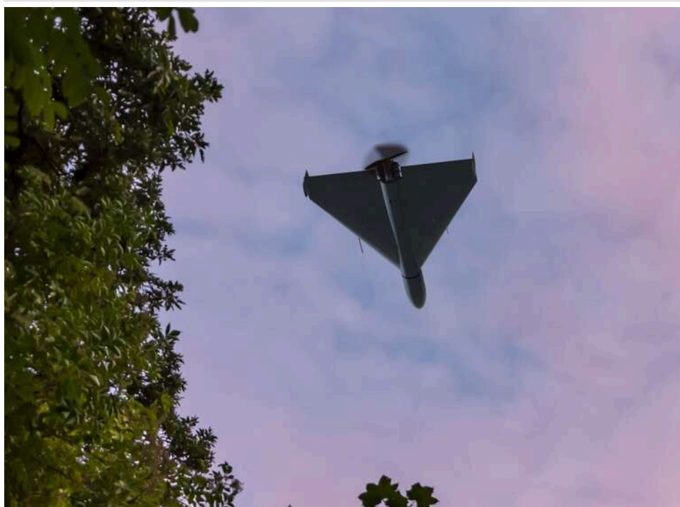
Приватна ППО вперше збила реактивний «шахед» на швидкості понад 400 кілометрів на годину, – Федоров

Приватна ППО вперше знищила реактивний «шахед» на швидкості понад 400 км/год.