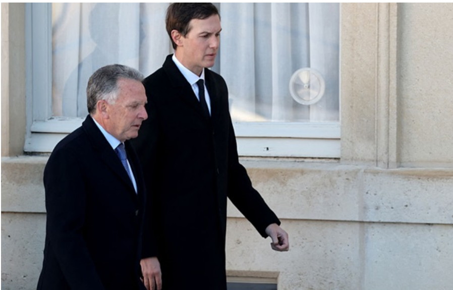
Стив Віткофф і Джаред Кушнер відвідають Україну

У Києві цього місяця очікують візит американської делегації на чолі зі спецпредставником Стівом Віткоффом та Джаредом Кушнером.