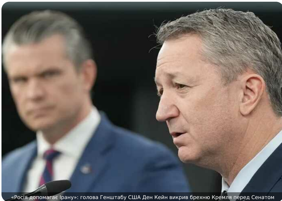
«Росія допомагає Ірану»: голова Генштабу США Ден Кейн викрив брехню Кремля перед Сенатом

Міністр оборони Піт Гегсет і голова Об'єднаного комітету начальників штабів генерал Ден Кейн сьогодні давали свідчення перед комітетом Сенату зі збройних сил.