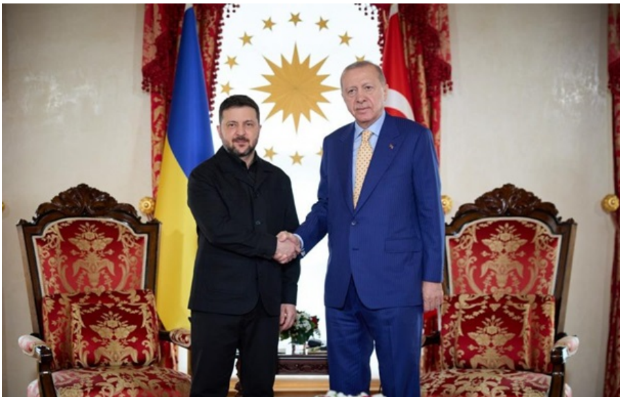
Фото: Пресслужба президента України Володимир Зеленський та Реджеп Тайїп Ердоган

Під час зустрічі в Стамбулі президенти України і Туреччини обговорили зміцнення співпраці у сферах безпеки та енергетики.