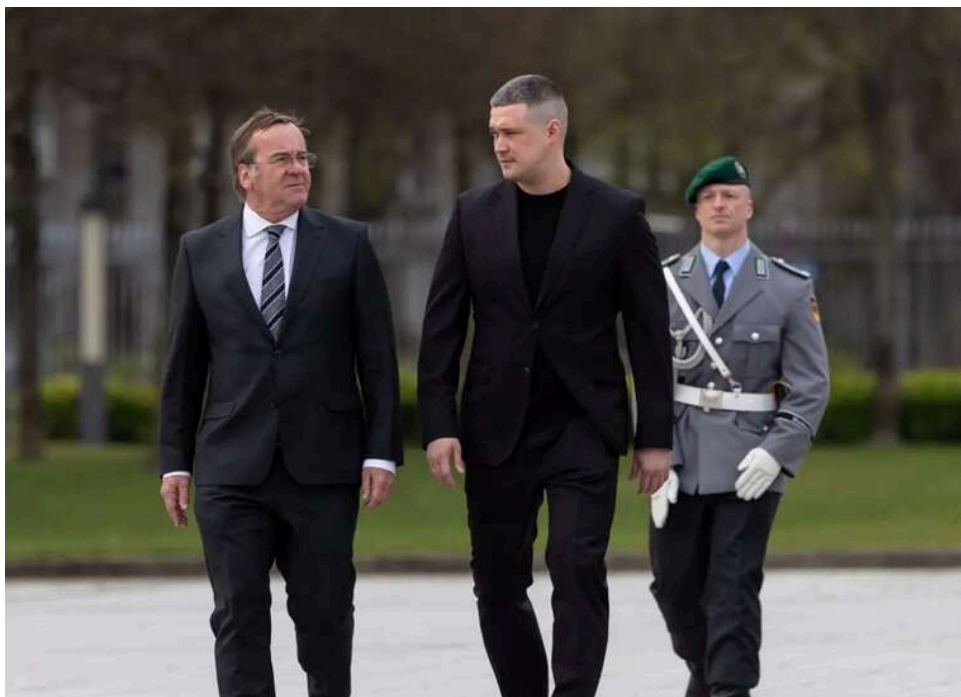
Україна та Німеччина підписали першу угоду про обмін оборонними даними, – Федоров

Глава Міноборони України Михайло Федоров і міністр оборони Німеччини Борис Пісторіус підписали першу для України угоду про обмін оборонними даними з партнерами.