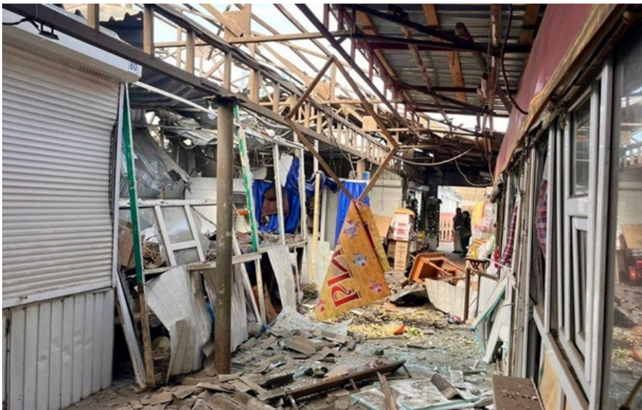
Наслідки удару по ринку в Нікополі

До 27 осіб зросла кількість поранених через ранкові дроніві удари росіян по ринку у Нікополі.