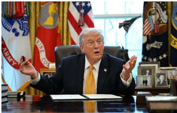
Фото: президент США Дональд Трамп (Getty Images)

Президент США Дональд Трамп заявив, що Вашингтон може розглянути скорочення військової присутності не лише в Німеччині, а й в інших європейських країнах.