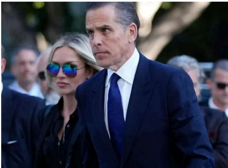
Гантер Байден виїхав із США на тлі боргів у 17 мільйонів доларів

Син колишнього президента США Джо Байдена – Гантер Байден – покинув країну і зараз живе за кордоном на тлі серйозних фінансових проблем.