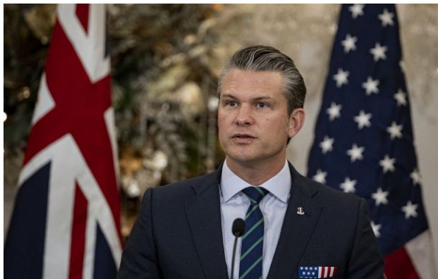
Фото: міністр війни США Піт Гегсет

США хочуть, щоб Європа почала фінансувати війну в Україні, оскільки загроза набагато ближча до них. Крім того, європейські країни є "багатими" і мають сукупний ВВП у 20 трлн доларів.