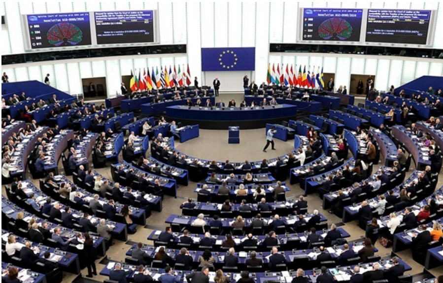
(ілюстративне фото)

Європарламент окремо підтримав створення Міжнародної комісії з претензій для України