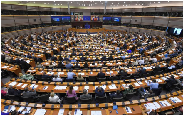
Фото: засідання Європарламенту (Getty Images)

Європарламент ухвалив резолюцію, в якій закликав притягнути керівництво Росії до відповідальності за війну проти України та посилити санкції.