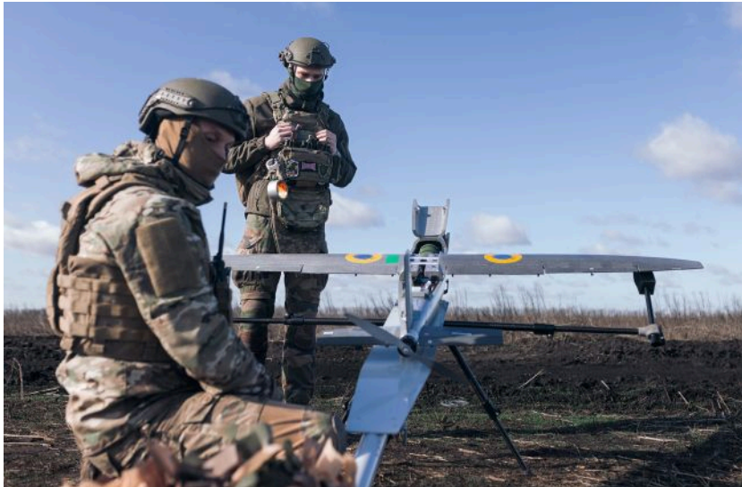
Фото: ЗСУ уразили НПЗ, склади БпЛА та ЗРК Тор-М2