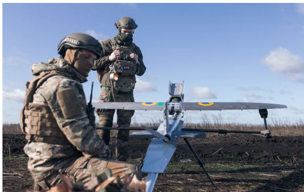
Фото: ЗСУ уразили НПЗ, склади БпЛА та ЗРК Тор-М2

Обирайте перевірене - додайте РБК-Україна до улюблених джерел у Google