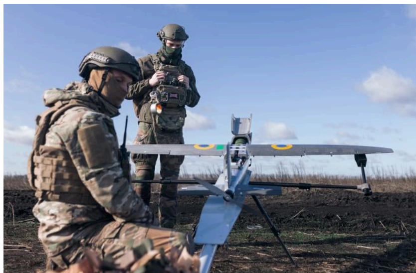
Фото: ЗСУ уразили НПЗ, склади БпЛА та ЗРК Тор-М2 (Getty Images)