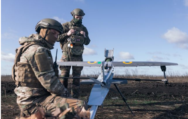
Фото: ЗСУ уразили НПЗ, склади БпЛА та ЗРК Тор-М2

Обирайте перевірене - додайте РБК-Україна до улюблених джерел у Google