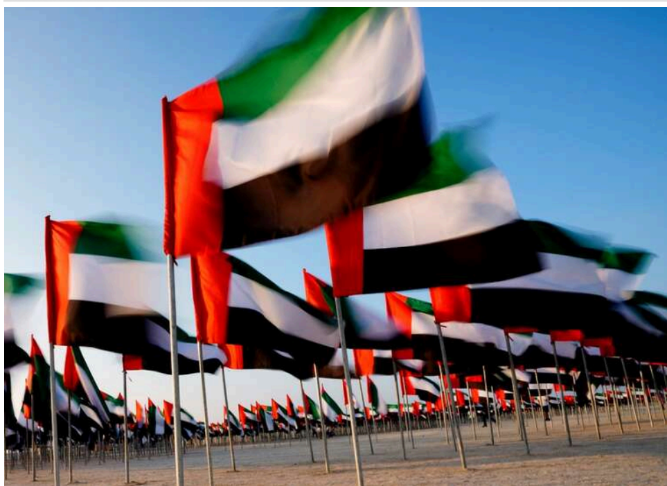
Іран вимагає компенсацій від арабських країн, звинувативши їх у співпраці зі США, – ЗМІ

Іран виставив сусідам мільярдні рахунки: Тегеран вимагає компенсацій від арабських країн за допомогу США.