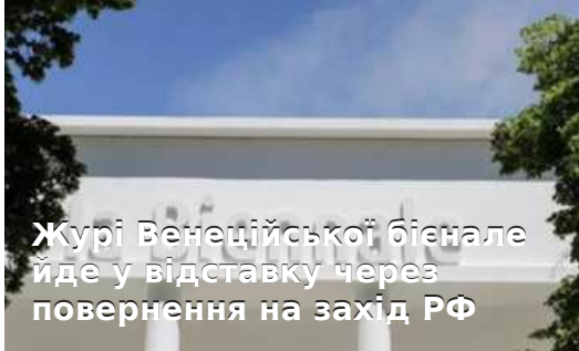
Журі Венеційської бієнале йде у відставку через повернення на захід РФ