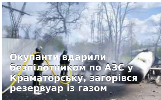
Окупанти вдарили безпілотником по АЗС у Краматорську, загорівся резервуар із газом