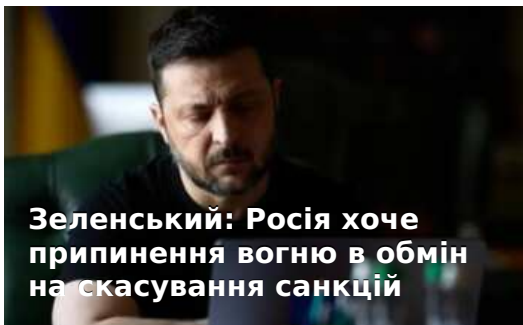
Зеленський: Росія хоче припинення вогню в обмін на скасування санкцій