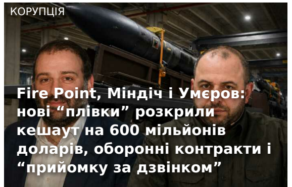
Fire Point, Міндіч і Умеров: нові "плівки" розкрили кешаут на 600 мільйонів доларів, оборонні контракти і "прийомку за дзвінком"