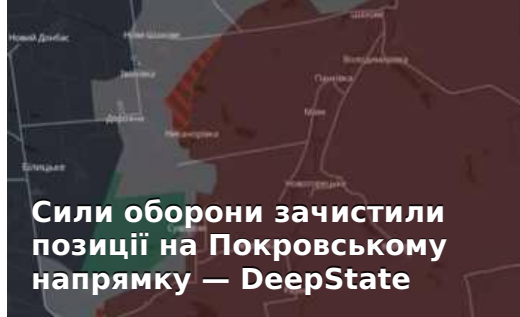
Сили оборони зачистили позиції на Покровському напрямку — DeepState