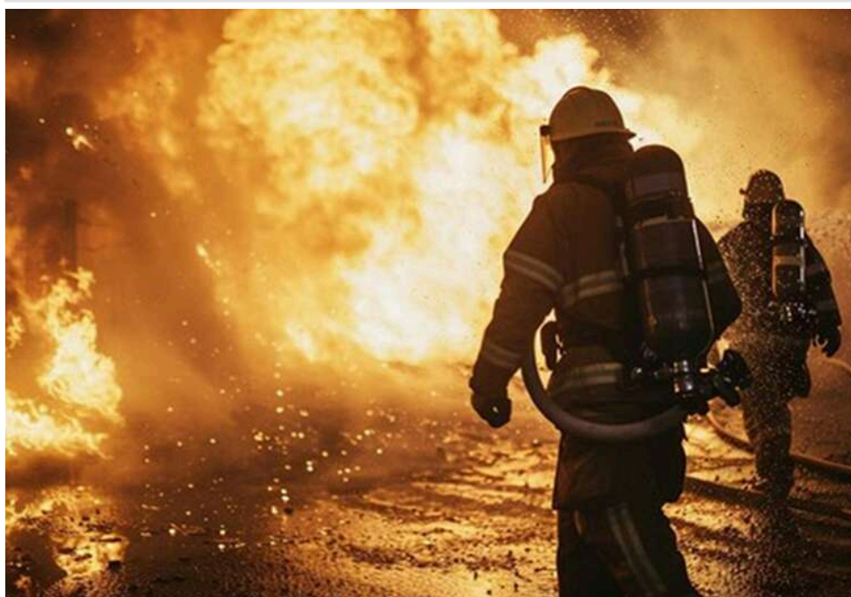
Удар по Николаєву: окупанти поцілили у житловий будинок, спалахнула пожежа

У Николаєві зафіксовано приліт у житловий будинок, інформують місцеві пабліки.