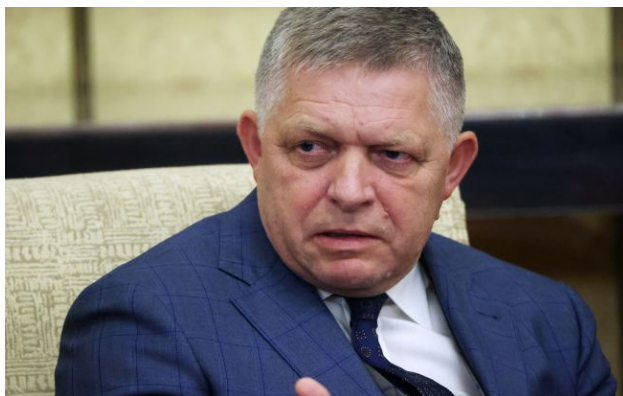
Фото: прем'єр-міністр Словаччини Роберт Фіцо (Getty Images)

Ціни на нафту прямо реагують на настрій та заяви президента США Дональда Трампа. Енергетичні ринки залежать від того, чи виспався американський лідер перед виступом.