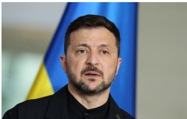
Фото: президент України Володимир Зеленський (Getty Images)

Україна визначила пріоритети дипломатичної роботи на європейському напрямку та готує кадрові рішення у Міністерстві закордонних справ і посольствах.