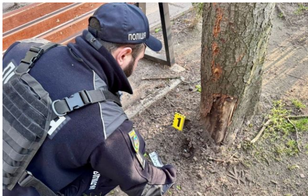
Фото: місце вибуху гранати біля ТЦК у Білій Церкві

У четвер, 30 квітня, о 18:13 поліція отримала повідомлення про те, що чоловік кинув гранату у бік адміністративної будівлі ТЦК у Білій Церкві.