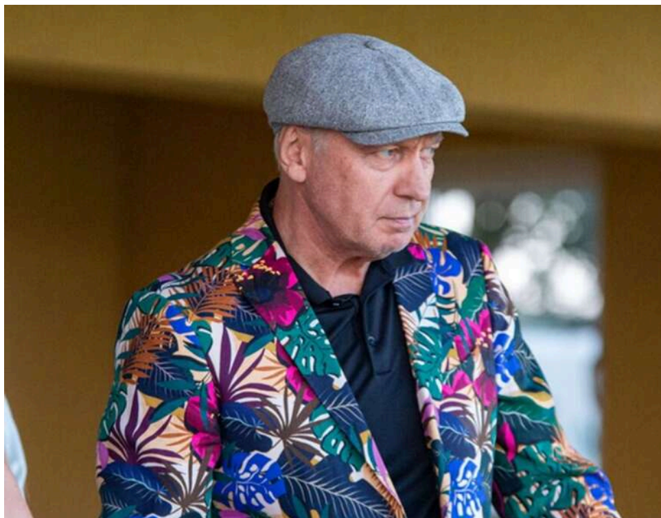
«Жодних переказів»: співвласник АТБ Буткевич заперечив участь у внесенні застави за Чернишова

Співвласник АТБ Геннадій Буткевич заявив, що не має жодного стосунку до сплати застави за ексвіцепрем'єр-міністра Олексія Чернишова.