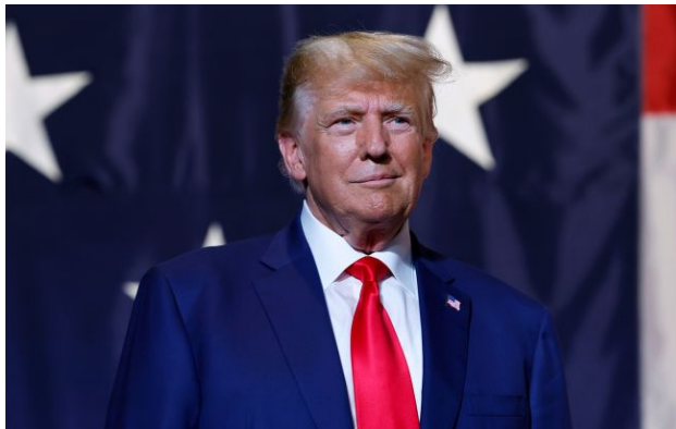
Фото: Дональд Трамп, президент США (Getty Images)

Близько 287 кандидатів номіновані на Нобелівську премію миру 2026 року. Ймовірно, серед них є і президент США Дональд Трамп.