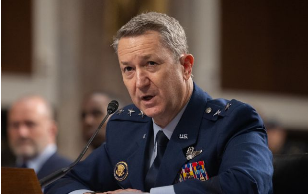
Фото: генерал Ден Кейн (Getty Images)

Росія допомагає Ірану у війні, що раніше заперечував Кремль. Про це стало відомо під час слухань у Сенаті.